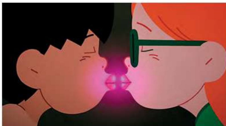
Beurk ! © Loïc Espuche

Échanger et se divertir autour d'une vingtaine de courts-métrages sélectionnés avec soin, telle est la promesse du festival Phare, dont la 11 e édition se déroulera au théâtre antique du 8 au 10 août. Fictions, animations et documentaires sont au programme avec cette année un trait commun, celui de l'humour. L'occasion de rire, donc, tout en découvrant de nouveaux talents et d'autres, plus anciens, à l'image de la réalisatrice Musidora, première vamp du cinéma. Les films d'animation ont