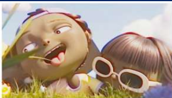
"Le jour où j'ai léché un caillou" a été réalisé par les étudiants de l'école de l'animation de l'Arles.