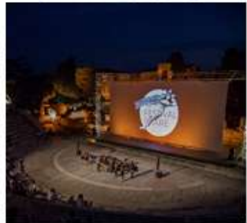
Programme et billetterie du festival Phare sur site festival-phare.fr