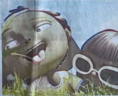
Une image du court-métrage "Le Jour où j'ai léché un caillou".

Une sorte de madeleine de Proust du souvenir d'enfance. Voilà comment Nathan Jauze, jeune diplômé de l'école MoPA, résume Le jour où j'ai léché un caillou , un court-métrage coréalisé avec cinq de ses camarades. On y suit trois enfants en vacances chez leur grand-mère, qui, un après-midi d'été, décident de traverser la campagne pour aller chercher leur goûter à la boulangerie et ainsi briser leur ennui. Un récit d'enfance simple, mais universel. "On a tous connu ces étés d'ennui trans-