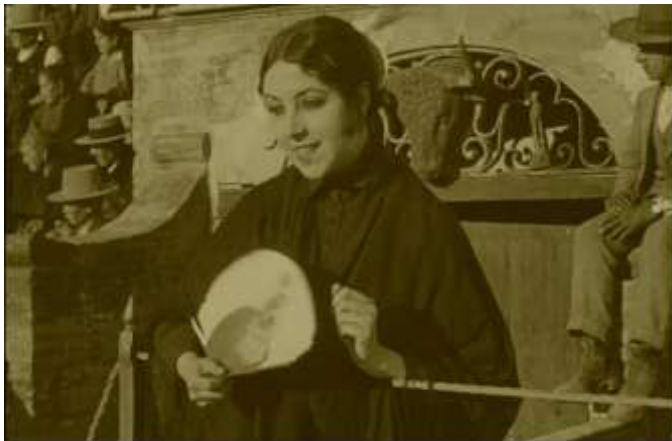
Musidora est à la fois actrice, réalisatrice et productrice du film Soleil et Ombre.

Le théâtre antique d'Arles accueillera, dimanche 10 août à 21 h, la projection exceptionnelle de Soleil et Ombre , film muet de Musidora, accompagné en direct par la musicienne Anna Idatte. Un ciné-concert unique et hors du temps, qui redonne vie à une pionnière du 7e art.