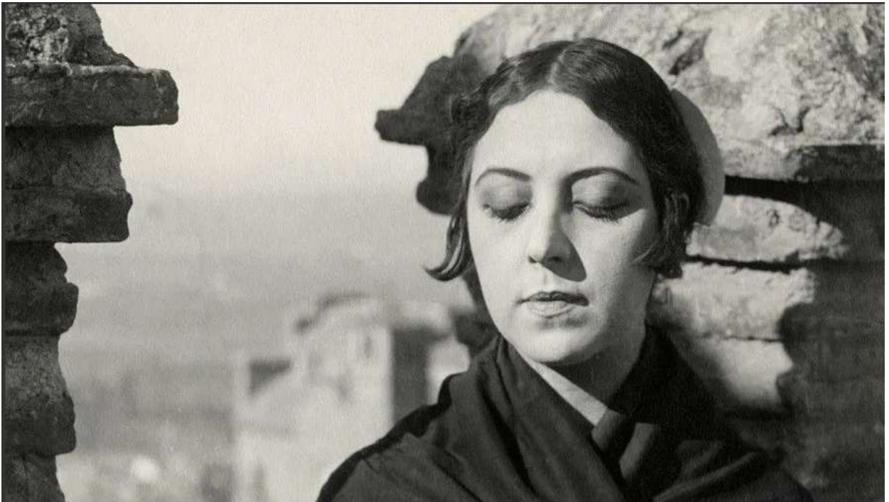
Musidora dans Soleil et Ombre (1922), film muet qu'elle a réalisé et interprété, projeté en ciné-concert lors de la soirée de clôture du Festival Phare.

ICI Provence est partenaire du Festival Phare, qui s'installe à Arles et à Fontvieille du 6 au 10 août pour sa 11 e édition. Un festival de courts métrages pas comme les autres, avec des films qui font du bien, de l'humour, de la musique et des surprises... le tout sous les étoiles !