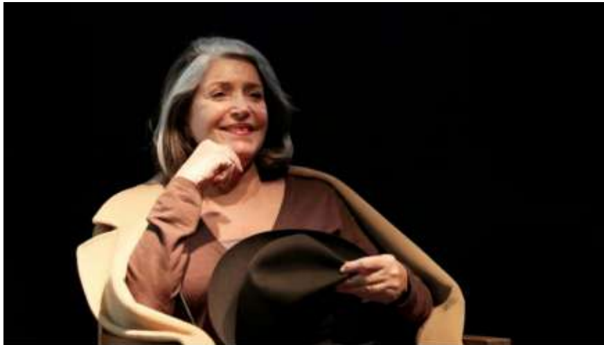
Françoise Fabian traverse le temps : plus de 80 films, 7 décennies devant la caméra et sur les planches. L'actrice de 92 ans sera à Fortvieille pour la soirée d'ouverture du festival Phare.

À l'occasion de sa présence jeudi 6 août à la cérémonie d'ouverture du festival arlésien du court-métrage, l'actrice culte de 92 ans évoque son lien avec la Provence, sa longue carrière et ses projets.