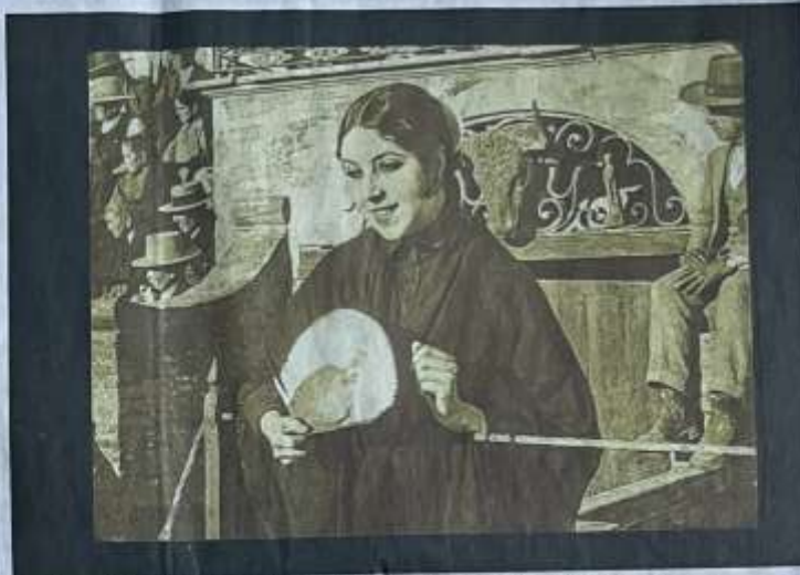
Musidora est à la fois actrice, réalisatrice et productrice du film "Soleil et Ombre".

Jeanne Roques, plus connue sous le nom de Musidora, était une artiste accomplie et touchée à tout. La première "vamp" du cinéma français fut aussi réalisatrice, productrice, poétesse, musicienne et femme de théâtre. Figure pionnière du 7 e