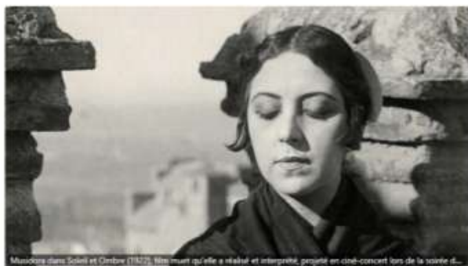
Musidora dans Soleil et Ombre (1922), film muet qu'elle a réalisé et interprété, projeté en ciné-concert lors de la soirée d...

« Le 10 août, pour clôturer le festival, une soirée spéciale rendra hommage à Musidora, grande figure du cinéma muet. Son film Soleil et Ombre , restauré en 1999 par la Cinémathèque française, sera projeté sur un écran géant de 20m, avec de la musique jouée en direct par la chanteuse, compositrice et multi instrumentiste, Anna Idatte. Un moment rare et émouvant, avec la complicité des Amis de Musidora . »